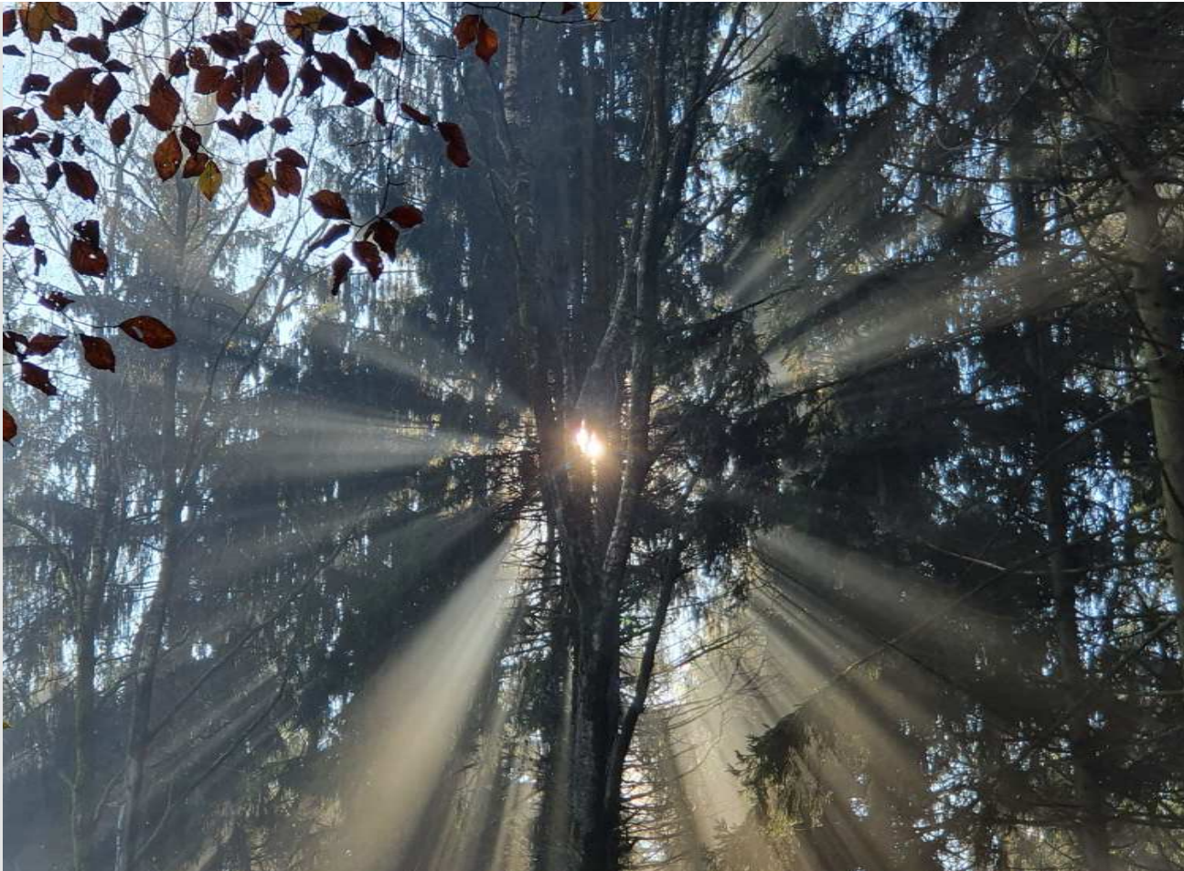
Naturschauspiel im Wald, Foto: Michael Öhlinger