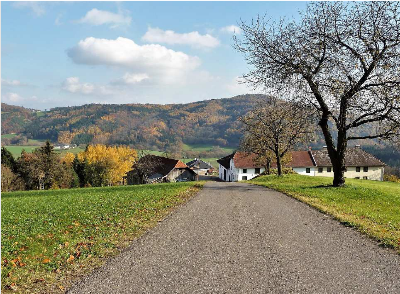
Hof Ralohner, Foto: Fotoclub Steyregg